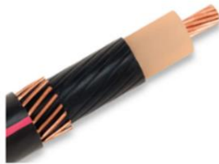
EPR/CN/LLDPE, MV-90 Type Primary UD