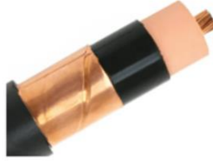
EPR/CTS/PVC Power, Type MV- 105