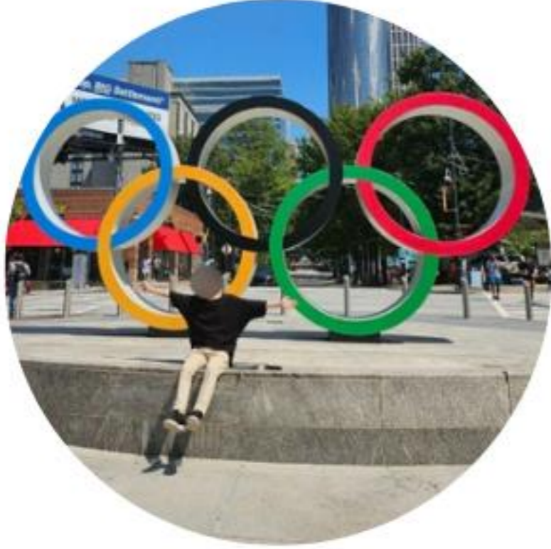
미국 애틀랜타 - LG chem 회계 업무

-더 넓은 세계를 볼 수 있고 영어로 말할 수 있는 기회가 많다고 생각했습니다.