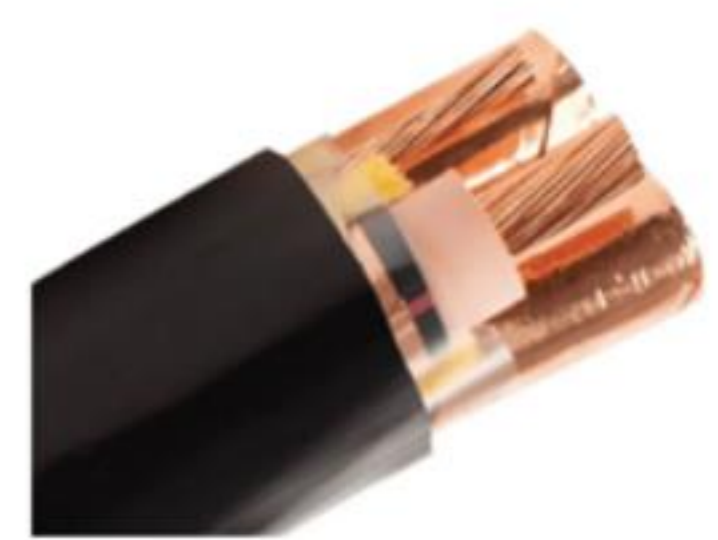
EPR/CTS/PVC Power, Type MV- 105, 3 Conductor

-위 치: 6625 The Corners Parkway, Suite 400 Peachtree Corners, GA 30092