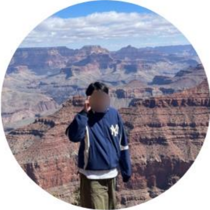
미국 미시간-LG Energy Solution Logistics team

미국에 나온뒤 종종 한국에 대한 그리움도 있었지만 얻어가는 것이 더 크다고 생각합니다. 처음에 나올때는 여러가지 설렘과 두려움이 공존하지만, 한달 두달 뒤에는 옛날에 언제 그랬나 싶을 정도로 즐기고있는 자신을 발견할 것입니다. 거주하는 동안 다양한 도시와 관광지들을 돌아보았고 사진이나 영상으로 보는 것들보다는 더 많은 영감을 얻고 경험을 하였습니다. 글로벌취업센터에서 준비를 도와주시고 조언도 많이 해주셔서 많은 도움을 얻었습니다.